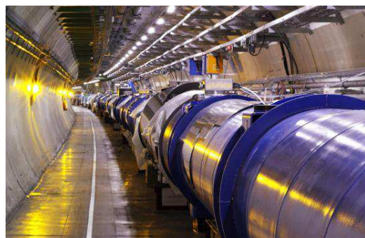
Vue intérieure du LHC

On fait circuler des paquets d'ions dans les deux sens. Ils entrent en collision frontale à une vitesse proche de celle de la lumière dans le vide : cette collision produit des bosons de Higgs. Leur durée de vie étant très brève, ils se désintègrent immédiatement en une multitude de particules. Ce sont ces particules qu'on détecte par l'expérience. Entre 2008 et 2011, 400 000 milliards de collisions ont été enregistrées. Une particule d'énergie de masse au repos d'environ 125 GeV a été détectée, avec un degré de confiance de 99,999 97 % : le boson de Higgs !